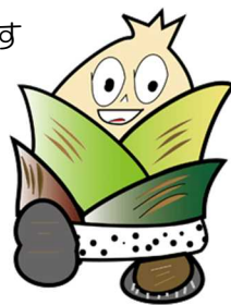
新野高校ゆるキャラ たけのこくん